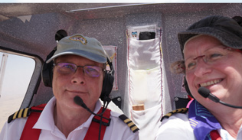
In Afrika fliege man am besten mit Streifen auf der Schulter – wurde uns gesagt. So könne man sicher sein, mit dem Respekt behandelt zu werden, den eine Pilotin verdient. Ob es geholfen hat? Keine Ahnung. Aber wir wurden nie mit Passagieren verwechselt.

Nun hatten wir Ferien vom Ramadan. Mit dem Mietwagen erkundeten wir die