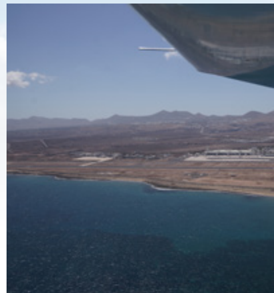
Anflug auf Arrecife Airport. Wir haben es fast geschafft. Nur noch die Maschine ordentlich landen. Der Wind ist ziemlich auf der Bahn und nicht zu böig.