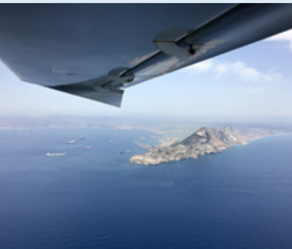
Gibraltar liegt auf dem Weg nach Tanger. Wir durchflogen die CTR. Der Controller sprach erwartungsgemäß bestes Englisch.

Im einem schönen Altstadt-Riad waren wir die einzigen Gäste. Gleich stürzten wir uns ins pralle Leben: Medina, Kasbah und