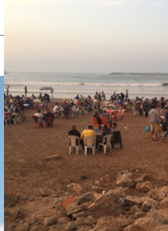
Erwartungsvoll warten die Menschen am Strand auf die Stimme des Muezzins. Die Tische sind gedeckt. Gleich beginnt der Schmaus.

Essaouira wirkt etwas französisch. Die Menschen sind zurückhaltender. Es gibt wieder kaum Touristen. In der Medina geht es entspannt zu und die Leute sind durchweg freundlich. Man kann bestes Arganöl, Kräuter, Gewürze und Gegenstände aus Thuja-Holz einkaufen. Schön sind - der alte Hafen und der riesige Strand – in der Hand weniger versierter Surfer – the windy city! Nachts kühlte es auf 20 Grad ab und es wurde sehr stürmisch. Der Sturm förderte Alpträume von einem weggewehten UL. Wir machten uns früh auf den Weg – Ziel war Fès. Der internationale Airport wurde eigens für uns aufgesperrt. Natürlich die obligatorischen Kontrollen. Trotzdem waren wir nach ca. 30