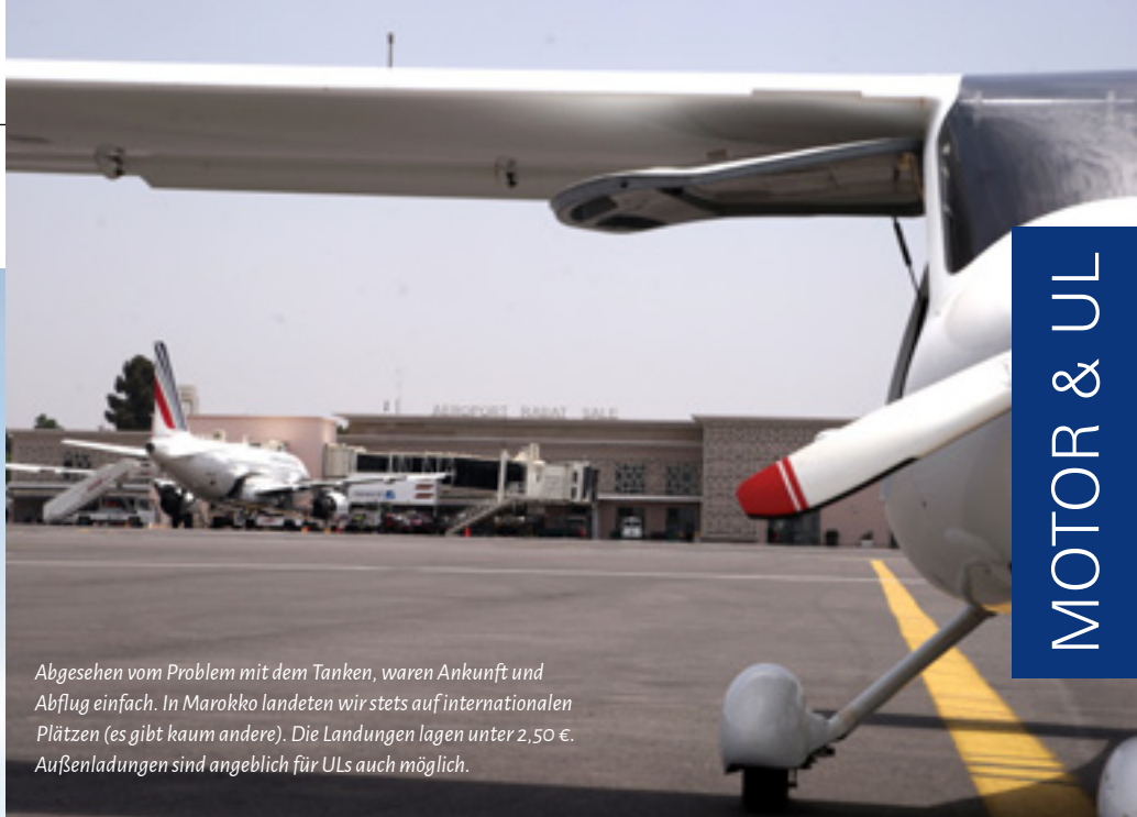
Abgesehen vom Problem mit dem Tanken, waren Ankunft und Abflug einfach. In Marokko landeten wir stets auf internationalen Plätzen (es gibt kaum andere). Die Landungen lagen unter 2,50 €. Außenladungen sind angeblich für ULs auch möglich.

Menschen leben da. Es ist die größte Nordafrikas und UNESCO Weltkulturerbe. Trotz der Hitze konnte man es ganz gut aushalten in den engen Gassen. Beeindruckend ist das Gerberviertel. Man kann den Gerbern bei der Arbeit über die Schulter blicken. Place Najjarin mit Museum, die Tore und vielen engen Gassen mit den Handwerkern und Läden verschafften uns bleibende Eindrücke.