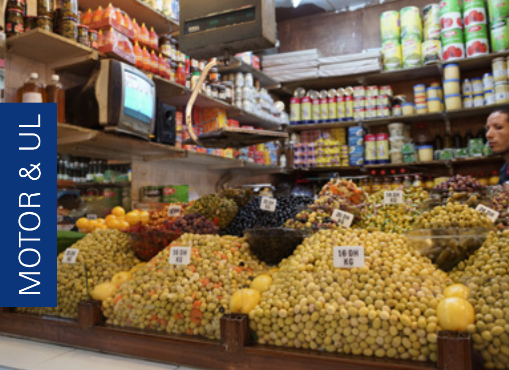
Reich ist das Angebot in Tangers Medina. Man kann Lebensmittel fast aller Art kaufen.

Insel, besuchten den Timanfaya Vulkanpark, die Lavahöhle Cueva de los Verdes und Strände. Überall offene Restaurants und – wenn man wollte – ein Glas Wein.