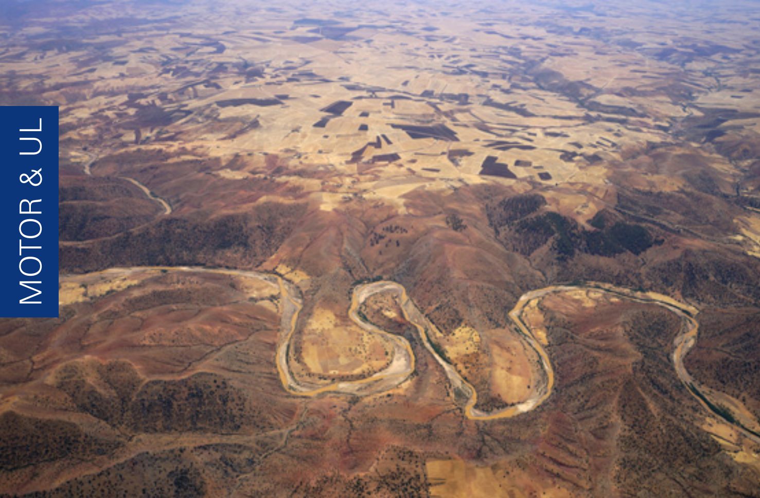
Fes Richtung Mittelmeer