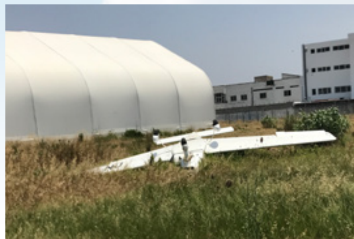
Der Einflug nach Tanger (GMTT) erfolgte meeresseitig über LINTO. Unser Handlingsagent holte uns ab und schleuste uns durch die Kontrollen. Er hatte die Einfluggenehmigung für unser UL besorgt. Oft weht in Tanger ein starker Ostwind, der Levante. Wir hatten Westwind – den Poniente. Das Flugzeug auf dem Rücken lag neben unserem Stand – also gut verzurren!