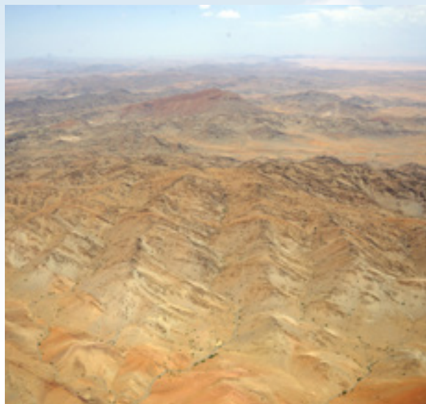
Zwischen Rabat und Marrakech überfliegen wir wüstes Land, das schön anzusehen ist von oben.