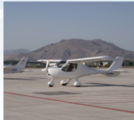
Es war ein langer und recht heißer Weg durch ganz Spanien. Granada (LEGR) ist als internationaler Flughafen für Ein- und Ausreise gut geeignet. Obligatorisches Handling kostete jeweils 100 € – bei anderen Flughäfen ist es noch teurer. Granada und die Alhambra – umwerfend!