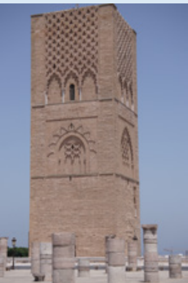
Der Hassanturm ist das Wahrzeichen von Rabat.

In dem wunderbaren Riad waren wir wieder die einzigen Gäste. Auf der Dachterrasse überblickten wir die gesamte Altstadt. Ein Spaziergang zeigte, wie riesig und labyrinthartig die Medina ist. Über 70.000