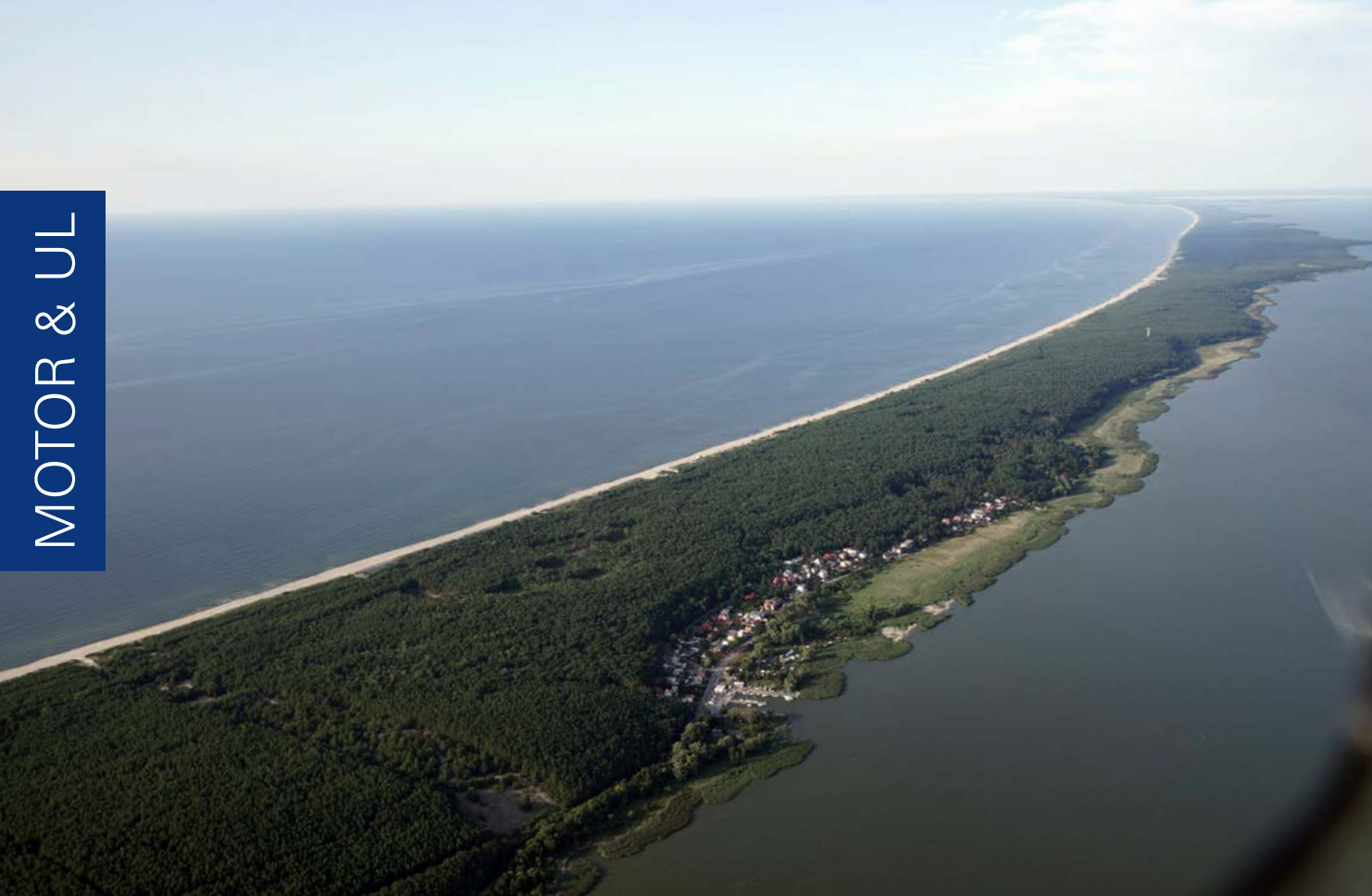
Russland erreicht – Anflug über das Frische Haff mit der Frischen Nehrung

1. Verkehrslandeplatz Deutschlands sein soll, wenn er doch in Russland liegt. Nun, die russische Exklave Kaliningrad ist das ehemalige deutsche Königsberg.