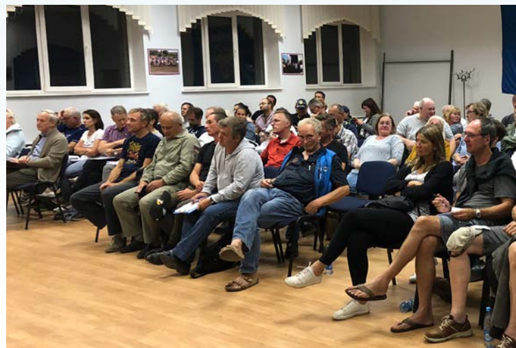
Die TeilnehmerInnen beim Briefing