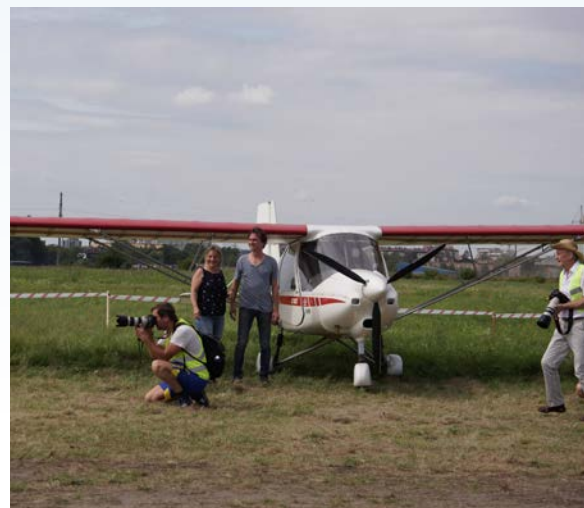
Tina flog die Maschine gerade vom Nachbarplatz Waldau nach DEVAU