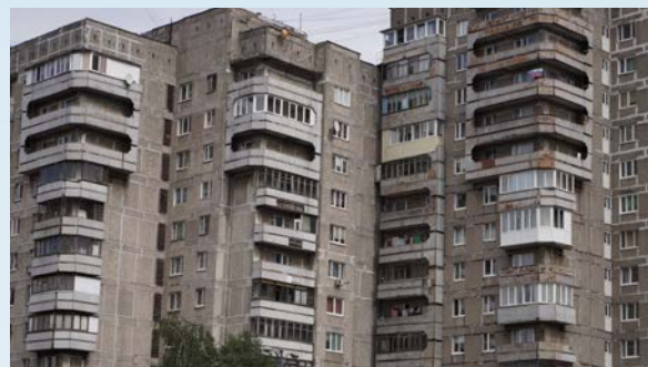
Leider gibt es in Kaliningrad auch solche Gebäude

Dann erhalten wir die Landefreigabe und ich setze die CT zum ersten Mal auf russischem Boden auf.