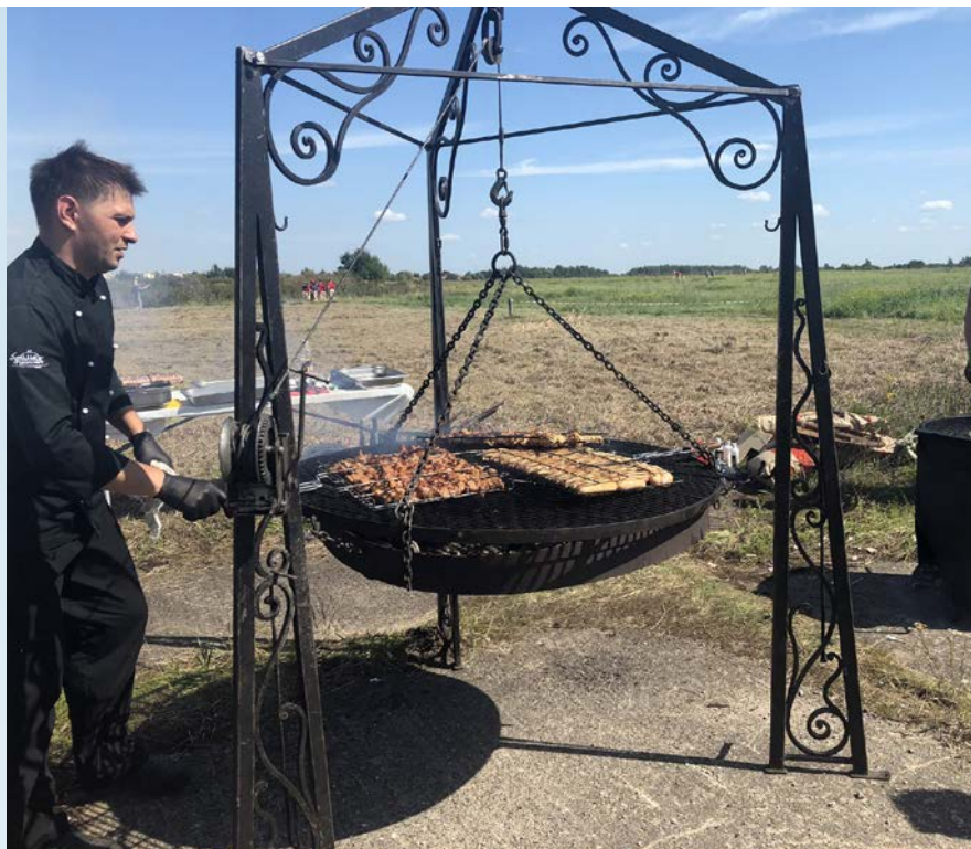
Leckere Speisen auf dem Flugplatzfest