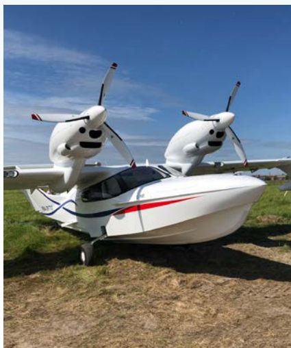
Das einzige teilnehmende russische Flugzeug – der volle Stolz des Besitzers