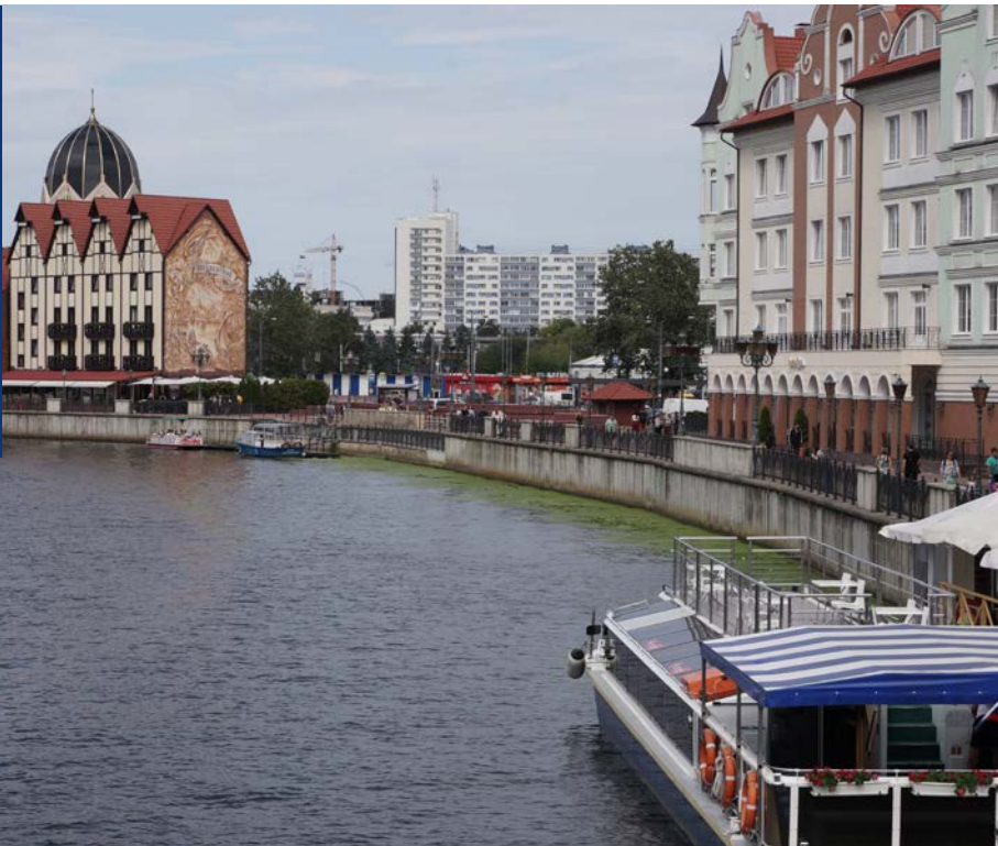
Die Touristenmeile von Kaliningrad

Maschine bekommt ein eigenes Abfertigungsteam. Dokumentenkontrolle und das Überprüfen der Maschine gehen schnell, auch die Flugplanaufgabe für den kurzen Hüpfen nach DEVAU. Ich bin von den Grenzbeamtinnen fasziniert. Sie machen das Vorfeld zum Catwalk. Wie aus dem Ei gepellt, mit High Heels in denen ich nach spätestens zwei Metern umknicken und auf die Nase fliegen würde, schreiten sie von Flugzeug zu Flugzeug. Ich komme mir in meinen Turnschuhen, Jeans und T-Shirt fast schäbig vor. Nicht mal eine Stunde nach der Lan-