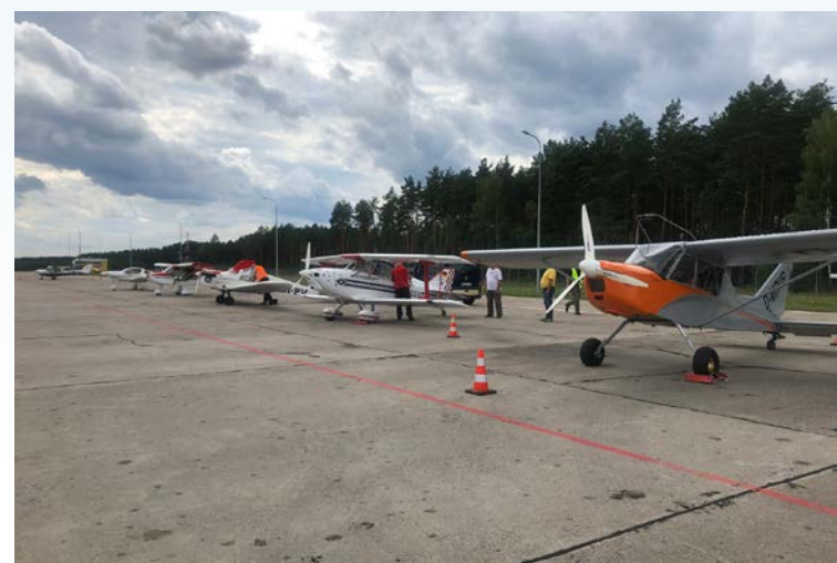
Auftanken in Polen beim Rückflug am Flughafen Olsztyn-Mazury – hier trifft man sich wieder