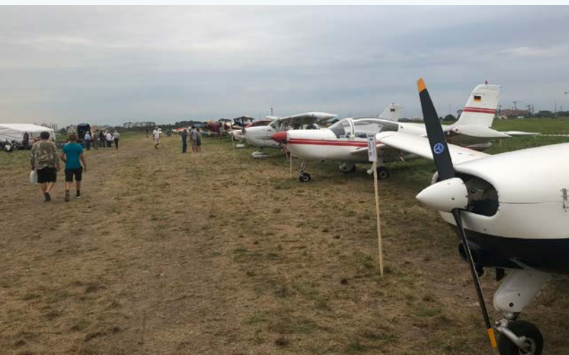
Taxiway und Ausstellung vornehmlich deutscher Flugzeuge

Immer entlang der Küste geht es nach Russland. Für mich „Südländer“, der in Oberbayern kurz vor der österreichischen Grenze