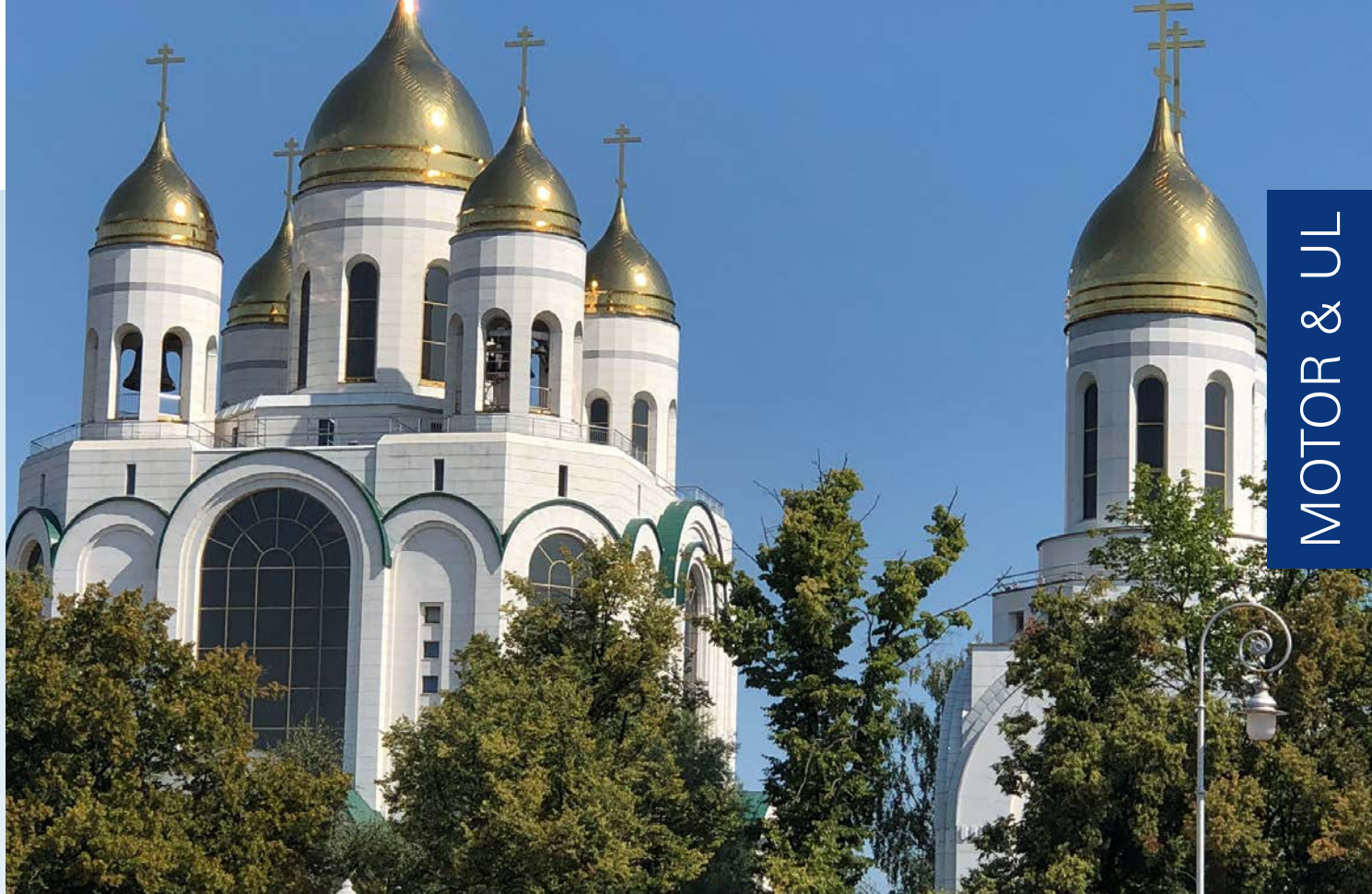
Die neue Orthodoxe Kirche