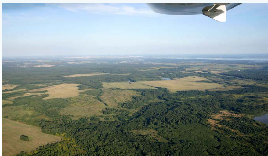
Über russischem Gebiet

Flugsicherheitsbehörde Ersatzmöglichkeiten diskutiert haben, eröffnete sich die Möglichkeit einer abgespeckten Veranstaltung. René fragte dann alle 80 gemeldeten Piloten, wer trotzdem kommen möchte. Auch dann, wenn man sich um alles selbst kümmern muss und wir nicht in DEVAU, dem 1. Verkehrslandeplatz Deutschlands landen können. Weniger gut Informierte könnten sich jetzt wundern, warum das der