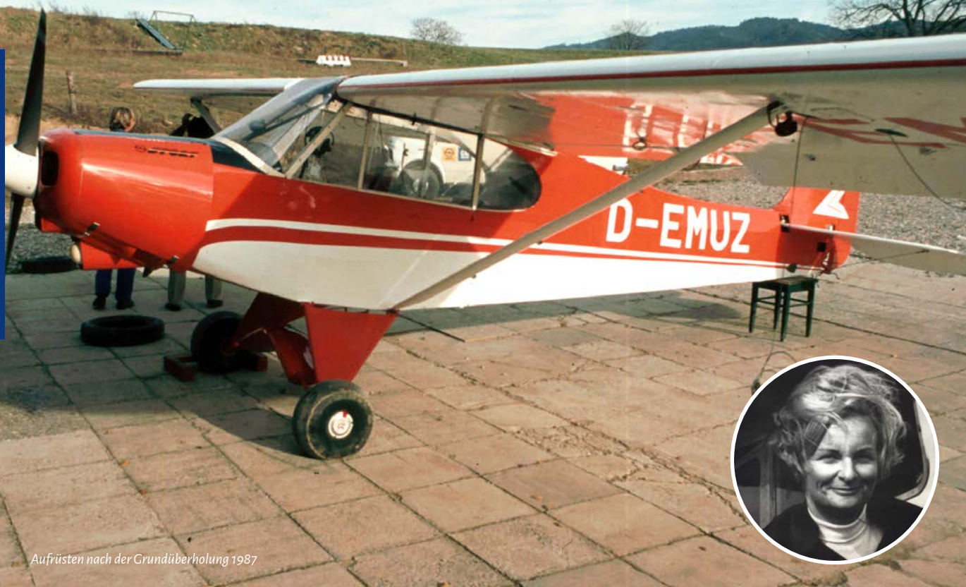
Aufrüsten nach der Grundüberholung 1987