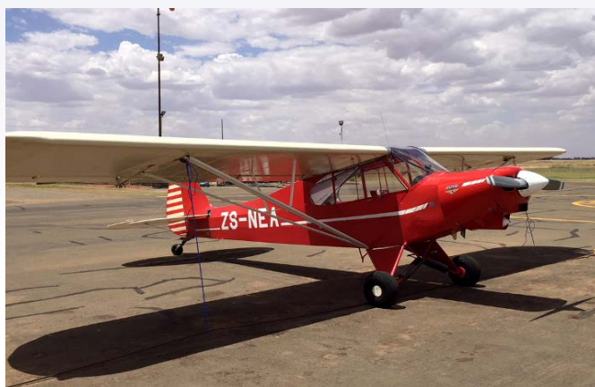
Piper PA-18 Super Cub c/n 18-1789 ZS-NEA at Bothaville in the Free State, 15 November 2015