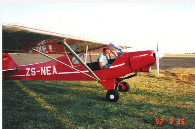
D-EMUZ heißt jetzt ZS-NEA in Südafrika!